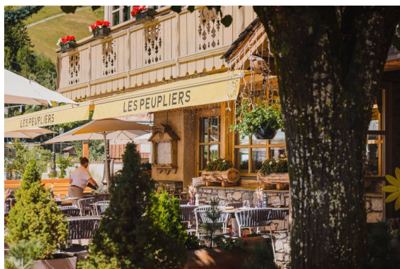
Hôtel Les Peupliers_Terrasse La Table de Mon Grand-Père

Côté desserts, les créations du chef pâtissier Téophane complètent le menu, dont Le Chocolat, la mousse de Mamie, gruë et praliné aux noix, devenu un incontournable de la maison.