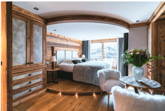
Hôtel Les Peupliers_Chambre supérieur village

Décoré avec goût, dans un style montagne traditionnel entre pierres, bois et motifs savoyards, l'Hôtel Les Peupliers **** compte, dans le bâtiment principal, 18 chambres et suites ultra douillettes (de 20 à 40 m 2 ) avec vue sur le village ou le lac.