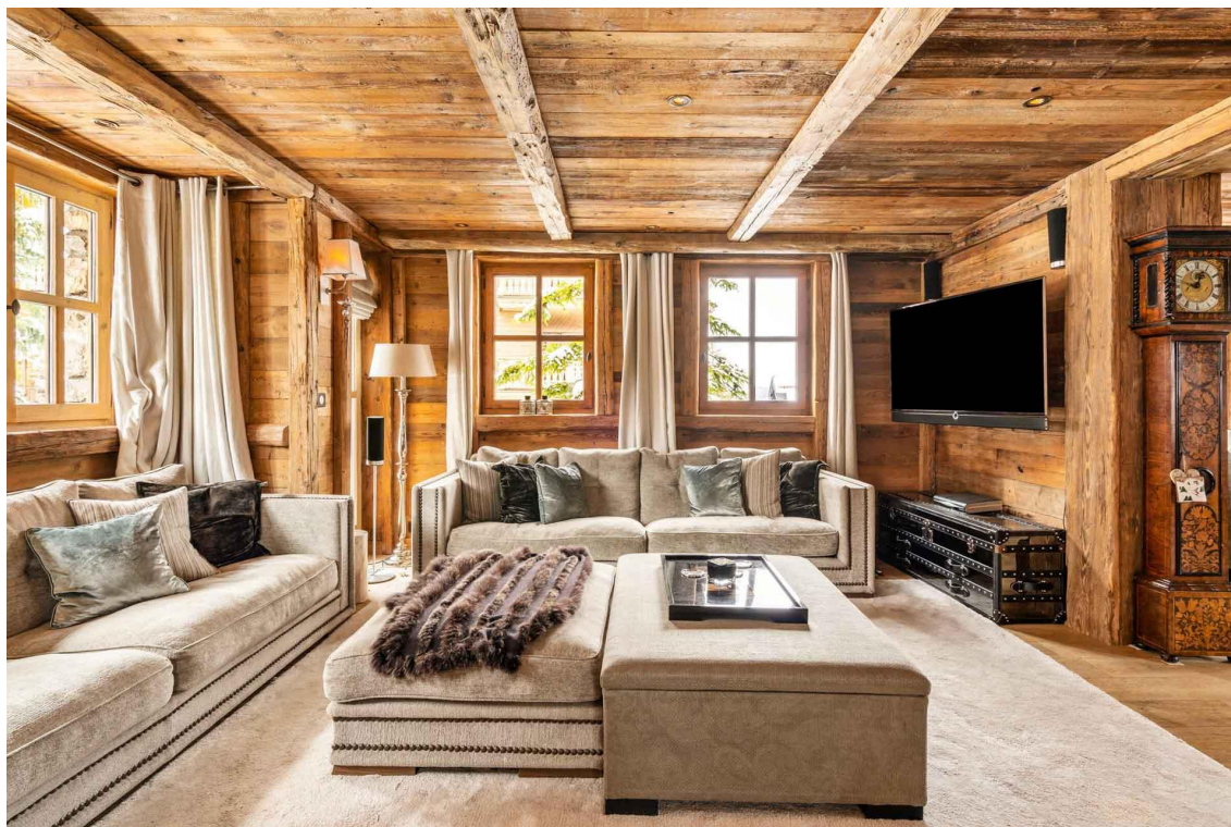
Chalet Saint James

La maison ? Champagne et fleurs fraîches souhaitent la bienvenue. Entièrement fait de bois (extérieur et intérieur) et de matériaux authentiques, on se retrouve au salon autour de canapés confortables, de somptueux lustre et d'éclairages plus subtils, d'une cheminée à foyer ouvert. Sur 400 m 2 , le chalet à Courchevel peut accueillir 8 à 10 personnes dans cinq chambres luxueuses, et autant de salles de bain décorées de grands miroirs et de beaux carrelages. Il offre en plus une salle de sport, un grand jacuzzi et un hammam pour se reposer après une longue journée de glisse ; des cours de yoga, la location d'un hélicoptère au cas où, des massages, sur demande un chauffeur dédié. C'est l'heure de passer à table pour un dîner concocté par un chef dans une cuisine... de chef.