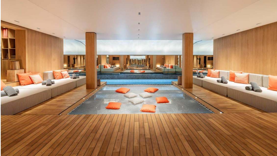
Chalets Altaï, espace bien-etre