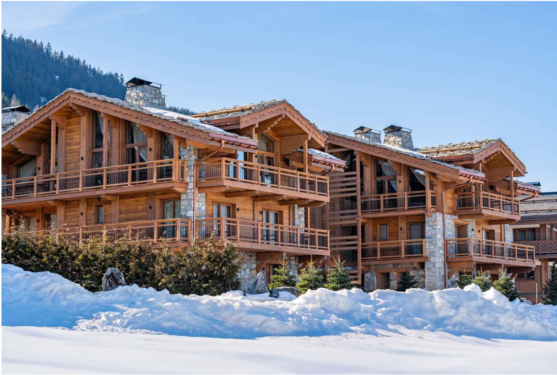
Chalets Altaï

La situation ? Dans le hameau de Courchevel Le Praz, proche de la forêt et en marge de l'agitation de la célèbre station de 1850. Une intimité et une « confidentialité » saupoudrées d'exclusivité et portées par une vision engagée et contemporaine du luxe alpin.