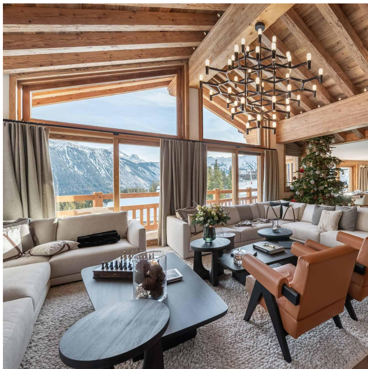
© Le Bruxellois, chalet de luxe à Courchevel

La maison ? Les codes de la montagne et de la chic station savoyarde sont au rendez-vous dans ce chalet de Courchevel de 6 chambres en suite : senteurs de vieux bois et pierre du pays, charpentes apparentes et hautes fenêtres lambrissées. Pour autant le récit est ludique, parfois même décalé. Au sommet, la suite parentale et son dressing reprennent l'effet malle... Louis Vuitton. On part en voyage ! Le bar et son plafond orné d'un feuillage tropical donnent l'impression d'être sous la canopée ; le coin enfant a été imaginé comme une cabane . Une forêt enchantée mène à un lac, autrement dit aux espaces de détente, spa et piscine, salle de sport et de massage, bain nordique. Au rez-de-chaussée une pièce de vie avec salon, salle à manger, cheminée centrale et vue à 360° sur le village et les montagnes au-delà. La cuisine ouverte est une belle mise en appétit et la terrasse plein sud un bonheur à l'heure du déjeuner.